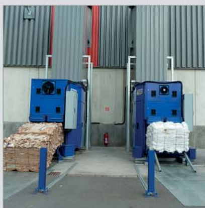
Vnější instalace s připojením ke stěně