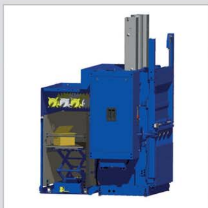
Funkce: automatické plnění