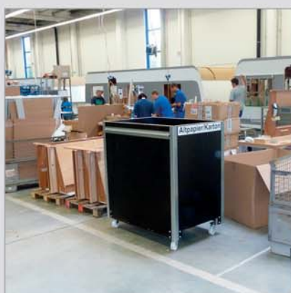
Odběr na místě: průmysl