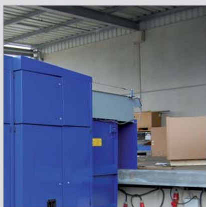
Instalace na rampě