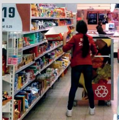
Odběr na místě: maloobchod