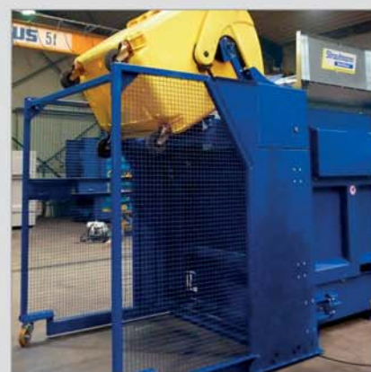
Plnění pomocí zvedacího/naklápacího zařízení